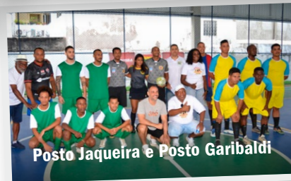
Posto Jaqueira e Posto Garibaldi